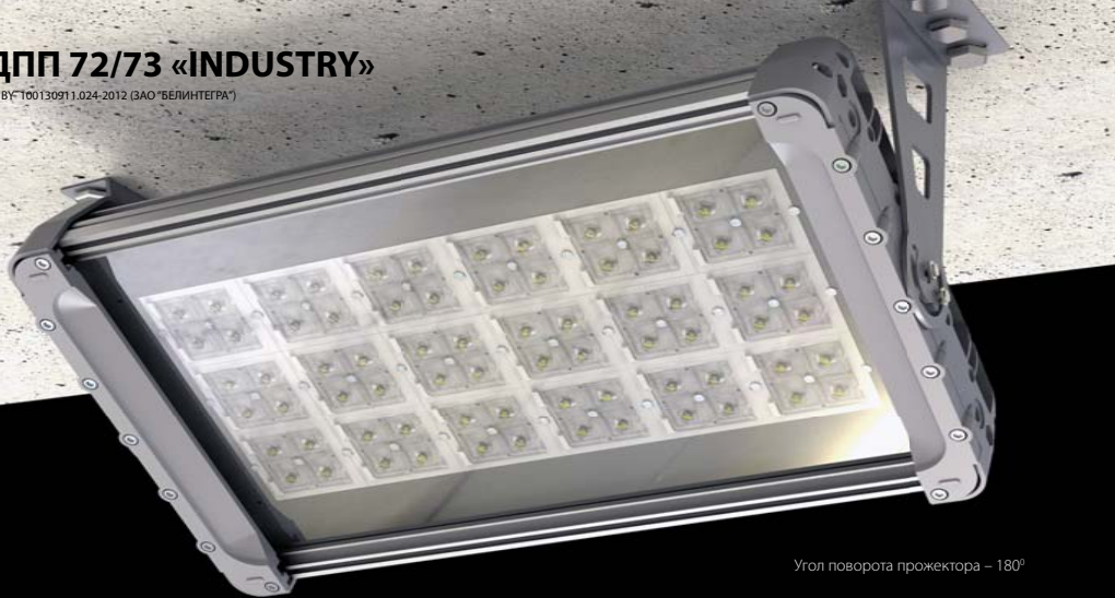
Угол поворота прожектора – 180°