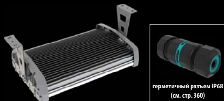
герметичный разъем IP68 (см. стр. 360)